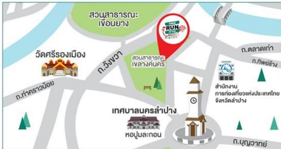
แผนที่สวนสาธารณะเวลาดังนคร จังหวัดลำปาง

*** เตรียมบัตรประจำตัวประชาชนเพื่อเป็นหลักฐานในการรับเสื้อและบิบ